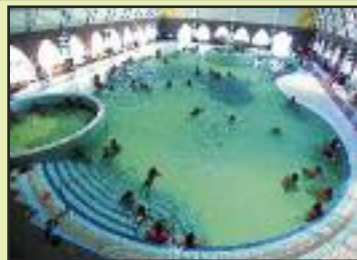
Sleva na vlastní dopravu: - 500,- / osoba

Cena zájezdu nezahrnuje: pojištění léčebných výloh, vstupné do termálních bazénů (dospělý cca 6,50 EUR, dítě do 15 let a senior nad 60 let 5,- EUR)